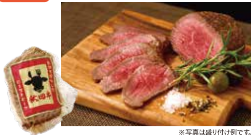
※写真は盛り付け例です。