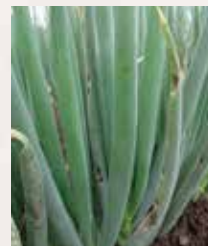
黒斑・さび病の症状が生じたねぎ

葉先の傷みや害虫による食害で傷んだ箇所から、カビ(黒斑)が発症して増殖し、黄色斑紋病斑も蔓延します。