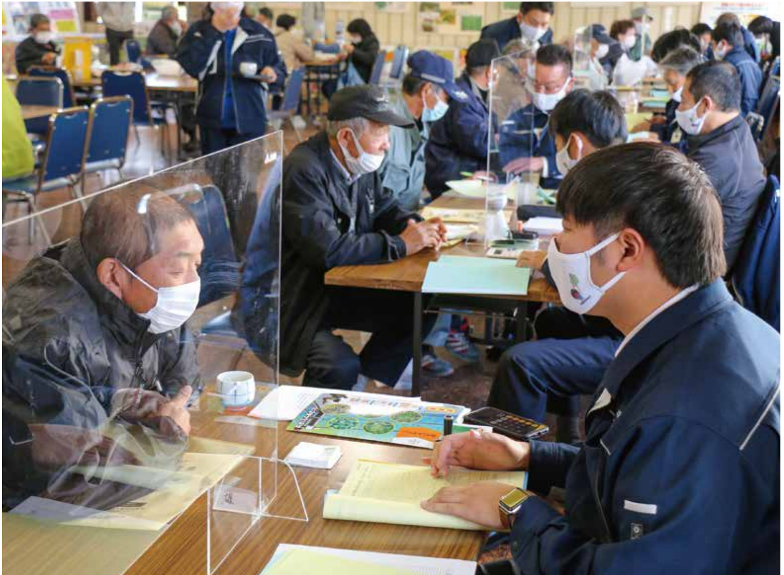
令和3年度の営農計画を相談(男鹿地区営農フェア)