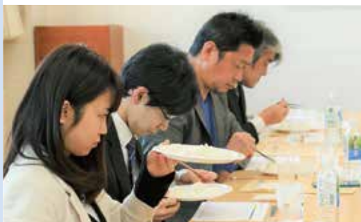
白米を観察する審査員

同コンクールは平成25年から行っており、今年で7年目となります。今年度の審査結果については1月に開催する生産者大会で表彰し、管内で限定販売する予定です。