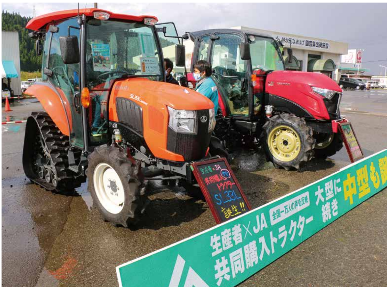
県内初展示の共同購入トラクター第2弾中型クラス「SL33L」(秋田地区営農フェア)