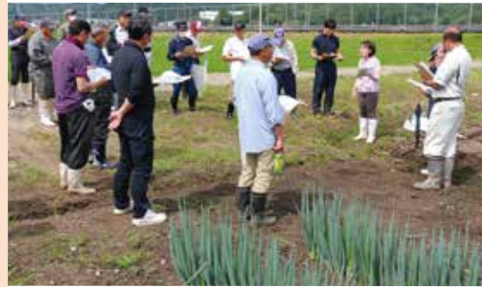
夏ネギの収穫前管理を学ぶ生産者

7月下旬には追分低温倉庫で目揃え会が行われ、他産地の情勢や出荷規格、収穫前の管理方法などを学びました。曇天が続いて病害虫の発生が懸念されるため、排水対策や防除を徹底して品質を維持するよう意思を統一しました。