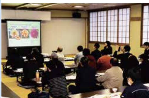
「NAMAHAGE」ダリアの新品種を学ぶ参加者

研修会では「NAMAHAGE」シリーズ第7期生の栽培試験結果などを学んだほか、9月に東京都中央卸売市場大田市場で投票が行われた同シリーズ第8期生3品種の紹介もされました。