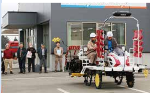
オート田植機を体験する参加者

講演後は実際にオート田植機の実演が行われ、自動直進と自動旋回を体験した参加者は、作業効率の向上が期待できる最新技術に興味深い様子でした。